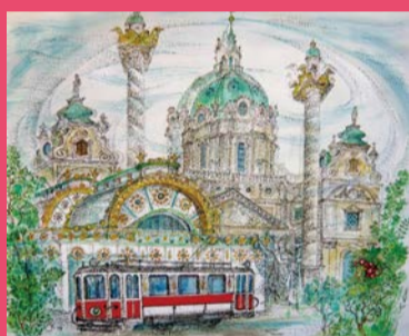
ミハヤエル・クーデンホーフ=カレルギー 「カールスプラッツ (ウィーン)」水彩 2009年 Michael Coudenhove-Kalergi „Karlsplatz (Wien)“ Aquarell, 2009

27. Jänner bis 07. Februar Bunkamura Gallery, Tokyo www.bunkamura.co.jp/gallery/