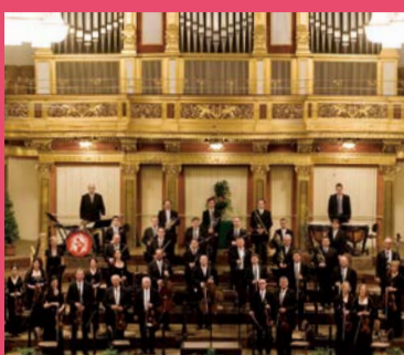
ウィーン・ヨハン・シュトラウス管弦楽団 Wiener Johann Strauss Orchester