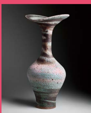
没後20年ルーシー・リー展 Lucie Rie A Retrospective 《スパイラル文花器》1980年 個人蔵 Estate of the artist

Jänner Human Trust Cinema Shibuya http://aoyama-theater.jp/feature/mitaiken2016