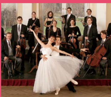
ウィーン・サロン・オーケストラ Salonorchester Alt Wien