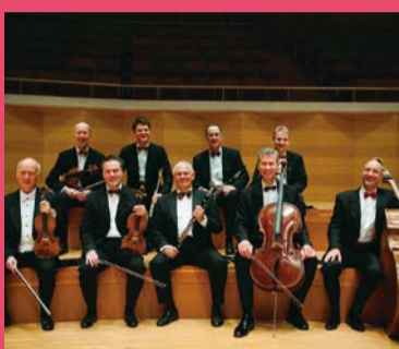
ウィーン・リング・アンサンブル Wiener Ring Ensemble