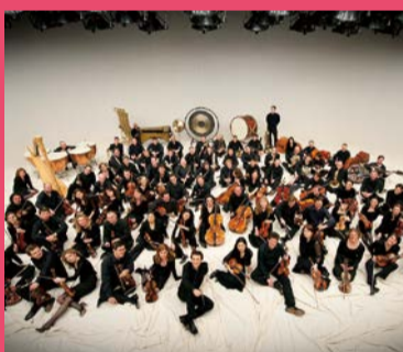
ウィーン放送交響楽団 ORF Radio Symphonie Orchester Wien