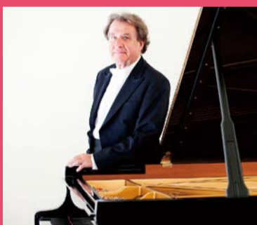
ルドルフ・ブッフビンダー (ピアノ) Rudolf Buchbinder (Klavier)