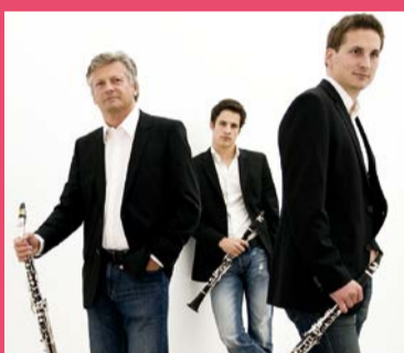
ザ・クラリノッツ Ottensamer Clarinet Trio