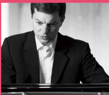
ティル・フェルナー (ピアノ) Till Fellner (Klavier)