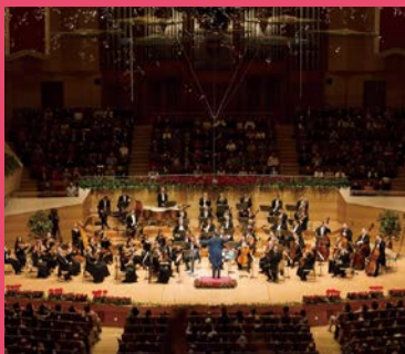
ウィーン・フォルクスオーパー交響楽団 Symphonie-Orchester der Wiener Volksoper