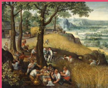
ウィーン美術史美術館所蔵「風景画の誕生」 Die Entstehung und Entwicklung der Landschaftsmalerei ; aus der Sammlung des Kunsthistorischen Museums Wien

9. bis 21. März Brecht Raum http://www.tee.co.jp/stage-shoukai-image/saigonoshinpan/der%20jungste%20tag.html