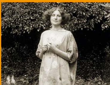
「カリオペ・オーストリア 社会、文化、学問における女性たち」 „KALLIOPE Austria. Frauen in Gesellschaft, Kultur und Wissenschaft“