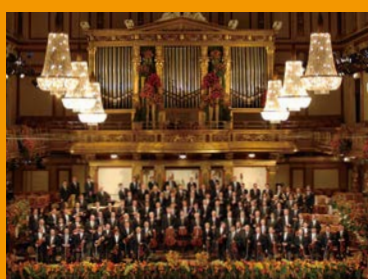
ウィーン・フィルハーモニー管弦楽団 Wiener Philharmoniker