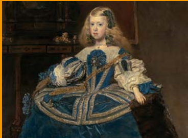
日本・オーストリア友好150周年記念 ハプスブルク展 600年にわたる帝国コレクションの歴史 150 Years Friendship Austria - Japan The Habsburg Dynasty: 600 Years of Imperial Collections ティエゴ・ペラスケス(青いドレスの女王マルガリータ・テレサ)1659年 ウィーン美術史美術館