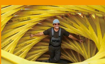
ライナー・プロハスカ Rainer Prohaska