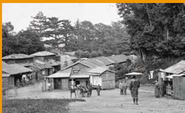
「日本・オーストリア国交のはじまり —写真家が見た明治初期日本の姿—」 „Beginn der diplomatischen Beziehungen zwischen Japan und Österreich – Meiji- Japan mit den Augen österreichischer Fotografen“ 芝切通 / 個人蔵 (カンマーホフ博物館寄託)