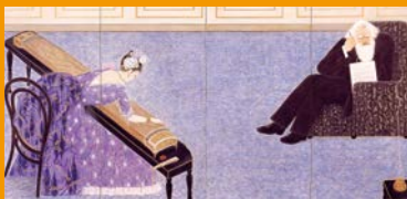
「19世紀末ウィーンとニッポン」 „Ausstellung aus dem Archiv/ Bibliothek / Sammlungen der Gesellschaft der Musikfreunde in Wien“ ウィーンに六段の調 / 大垣市守屋多々志美術館 蔵