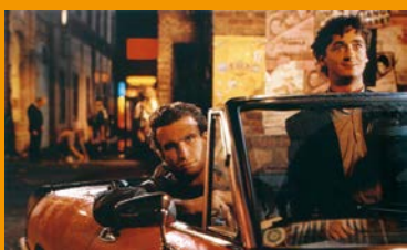
オーストリア映画・ハンガリー映画特集 Filmen aus Österreich und Ungarn Aus Anlass des 150-jährigen Jubiläums diplomatischer Beziehungen mit Japan