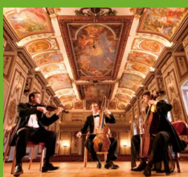
エステルハーザー・アンサンブル Esterházy Ensemble