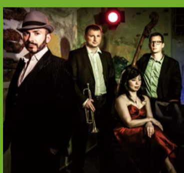
カルテット・カメセッレ Cuarteto Cameselle

Information: Japan Arts Corporation Tel. 03-5774-3040 https://www.japanarts.co.jp/wsk2019/