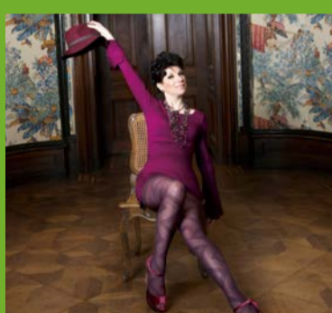
エリーザベト・クールマン (メゾソプラノ) Elisabeth Kulman (Mezzosopran)