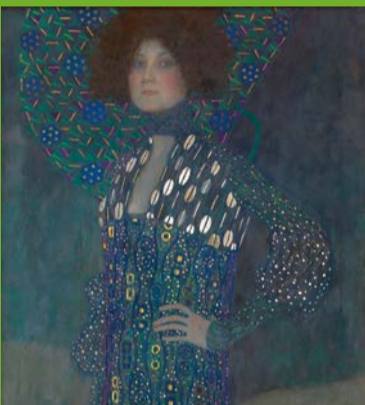
「ウィーン・モダン クリムト、シーレ 世紀末への道 „Vienna on the Path to Modernism“」