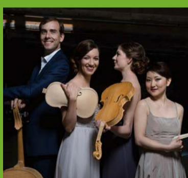
ストラトス・カルテット Stratos Quartett

Information: http://www.cuartetocameselle.com/