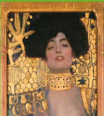
「クリムト展 ウィーンと日本 1900 „Gustav Klimt: Vienna - Japan 1900“」