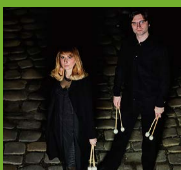
ルシッド・デュオ (マリンバ) Lucid Duo (Marimba)

Information: http://www.tokyo-harusai.com/