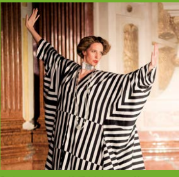
「エミリー・フレージェ 愛されたミュース „EMILIE FLÖGE – Geliebte Muse“」