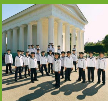
ウィーン少年合唱団 Wiener Sängerknaben