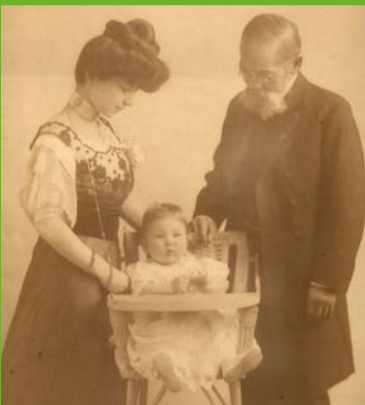
「江戸時代から続く日独・日奥交流 Austausch zwischen Japan und Österreich / Deutschland seit Edo-Zeit」