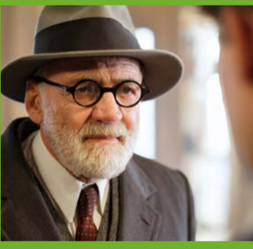
「キオスク ニコラウス・ロイトナー監督 „Der Trafikant“ Regie: Nikolaus Leytner」